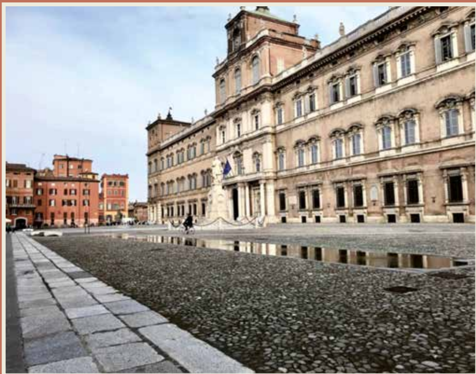
Modena - Piazza Roma

associazione culturale di promozione sociale per l'educazione permanente