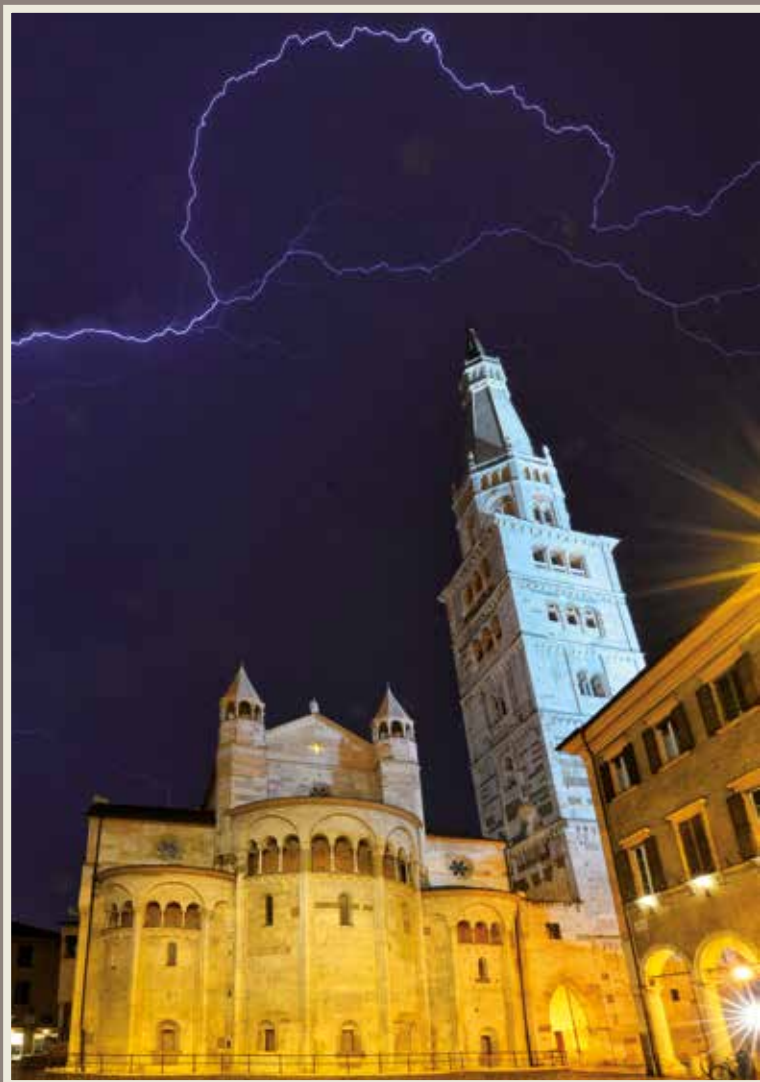
Modena - Piazza Grande