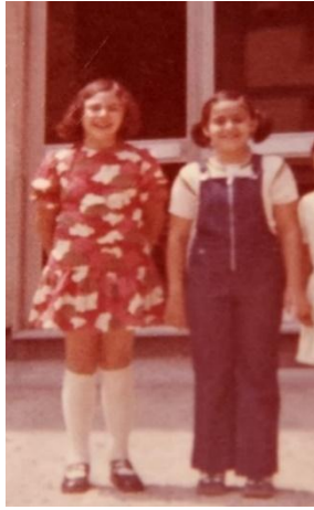
Foto davanti al mio portone

L'infanzia è finita troppo in fretta, e con le scuole medie per me è iniziato un periodo che ricordo come un mattone in testa: non tanto per il dolore fisico, quanto per lo stordimento che mi lasciò, un vuoto che mi fece dimenticare i giorni felici appena trascorsi e perdere tutti i riferimenti acquisiti.