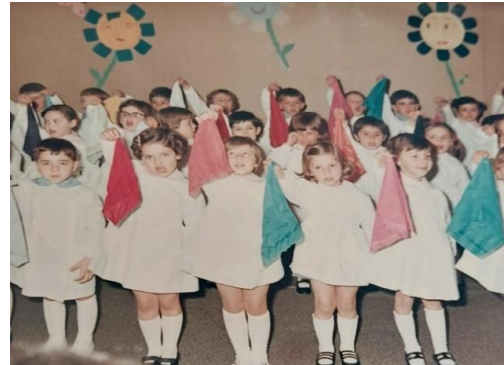
Festa ma la Ro piange

Poi quando arrivava l'ora del riposino, le nostre brandine erano sempre vicine, e prima di lasciarsi andare alla nanna, era bello scambiarsi uno sguardo e un sorriso d'intesa.