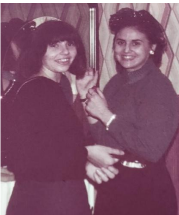
Gita a Montecarlo

Siamo cresciute, tu forse anche troppo in fretta, hai avuto un bimbo giovanissima, ma in quel periodo ci siamo ritrovate.