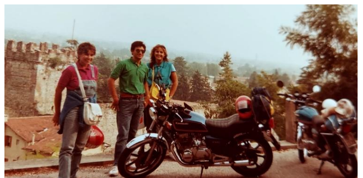
Gita a Marostica

Ancora oggi che siamo nonne, la nostra amicizia resta ben salda.