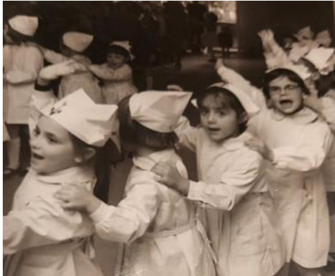
Asilo in fila per il pranzo

All'ora di pranzo tutti ben allineati, le mie manine sempre appoggiate sulle tue spalle, si andava a tavola cantando "Andiam andiam andiamo a desinar".